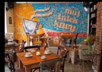
Můj šálek kávy