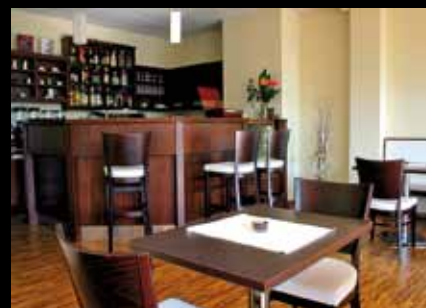
Coffee Club Cafeteria