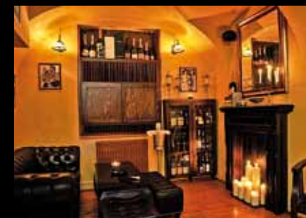
Hemingway bar Praha