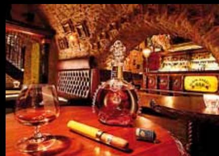
Black Angel's Bar