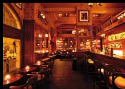
Bar and Books