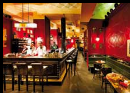
Tretter's Cocktail Bar